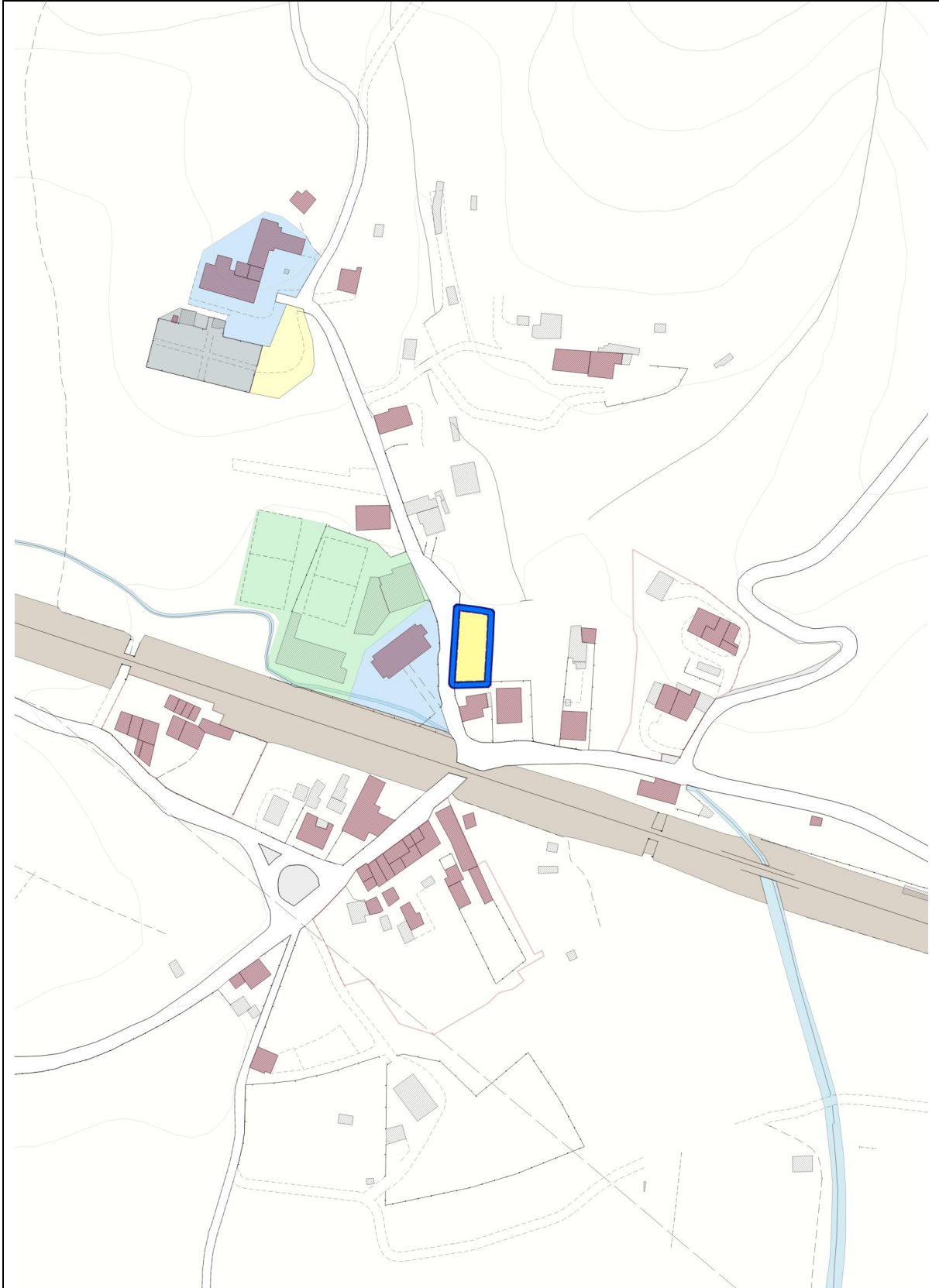
Indicazioni localizzative di dettaglio del PO (originale scala 1:2.000)